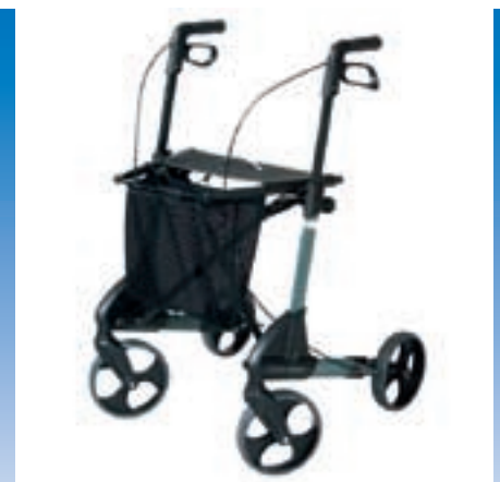
Rollator 5 Jahre Hersteller-Garantie