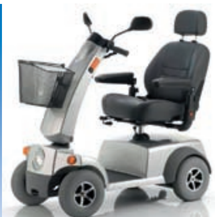
Scooter 412 Cityliner Meyra - Orthopädie