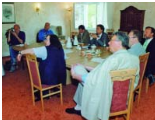
Bilder von der gemeinsamen Pressekonferenz der COOP Minden-Stadthagen und der Medicare Unternehmensgruppe zum Bauvorhaben Gesundheits- und Seniorenzentrum am Simeonsplatz