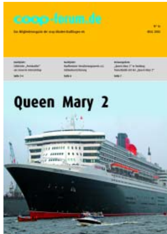
Titel der Mitgliederzeitung

Mit kleinen Anzeigen in der Regionalpresse werben wir für unser Internetkaufhaus. Auch hier werden wir die Entwicklung in 2006 weiter beobachten.